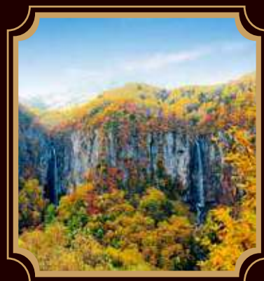
●国指定名勝 米子瀑布群