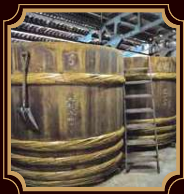
●信州須坂の味噌蔵

このマークは、信州須坂を代表する認定土産品の証です。デザインは、信州・須坂の蔵のまちをイメージしています。