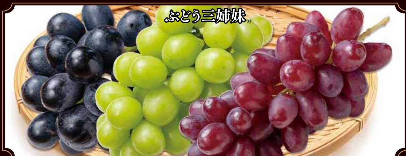
●須坂で生まれた「ナガノパープル」 ●シャインマスカット ●須坂で生まれた「クイーンルージュ」