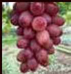
クイーンオブザサウス