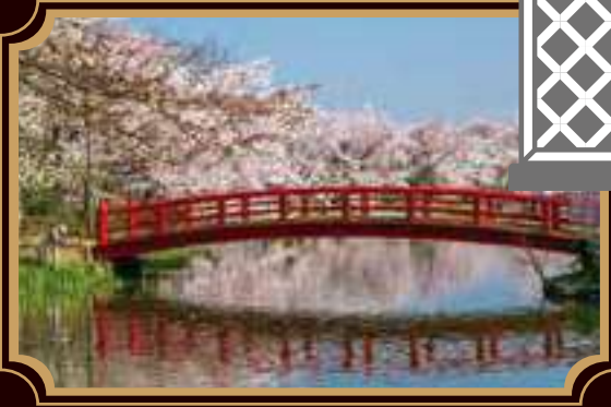
●日本のさくら名所100選「臥竜公園」