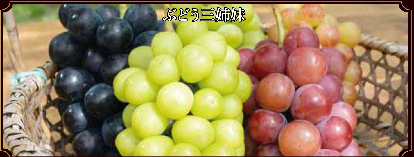
●須坂で生まれた「ナガノパープル」 ●シャインマスカット ●須坂で生まれた「クイーンルージュ」