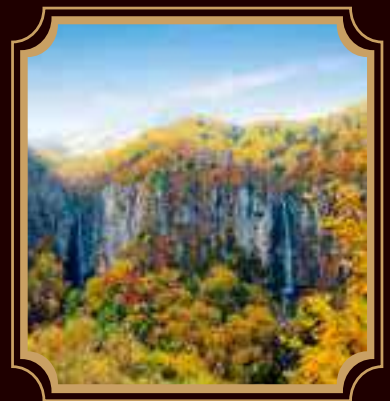
●日本の滝100選「米子大瀑布」