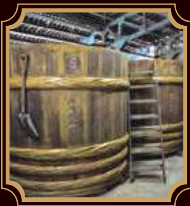
●信州須坂の味噌蔵

このマークは、信州須坂を代表する認定土産品の証です。デザインは、信州・須坂の蔵のまちをイメージしています。