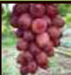
クイーンルージュ